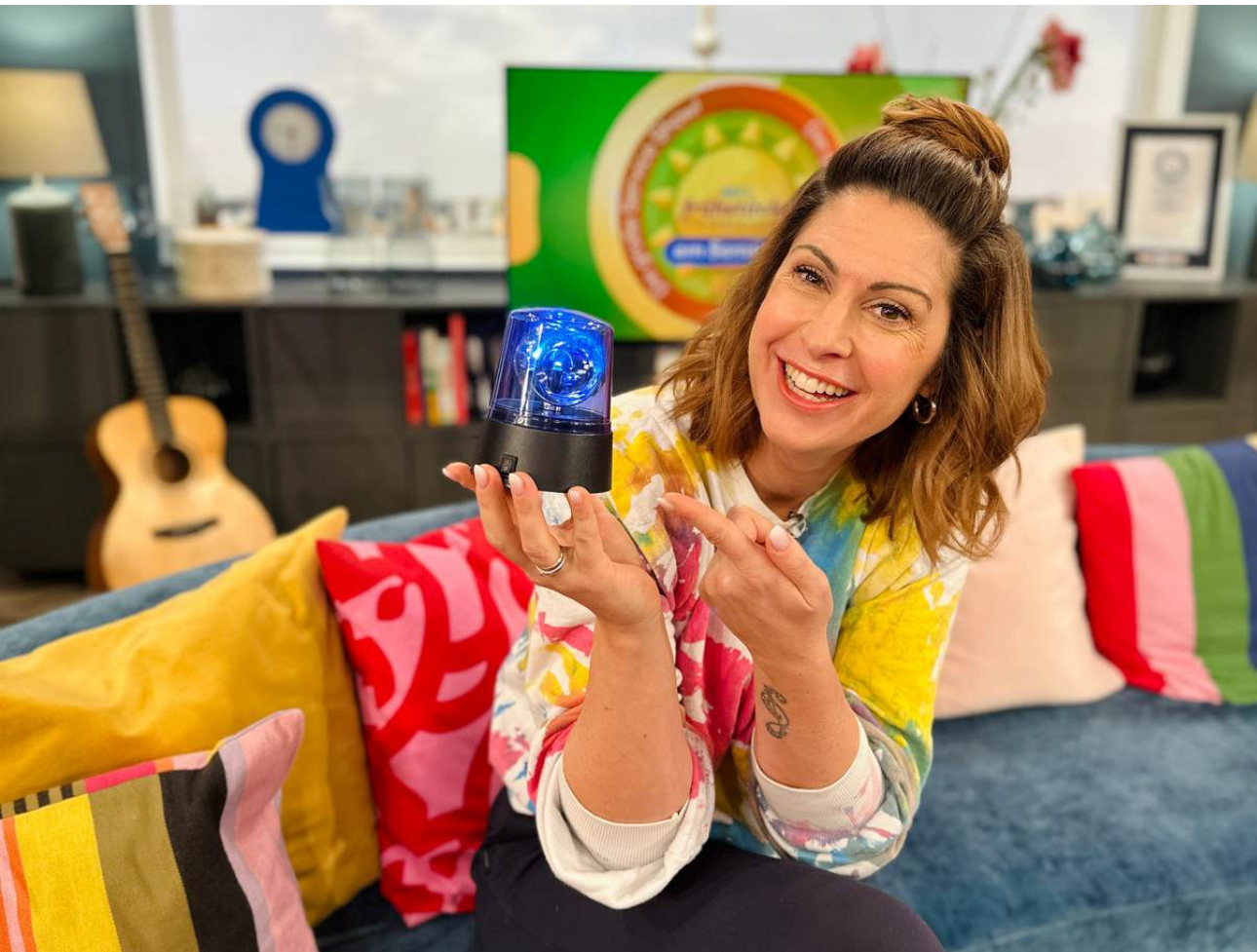
Sat.1 Frühstücksfernsehen 9.00 Uhr | Sat.1